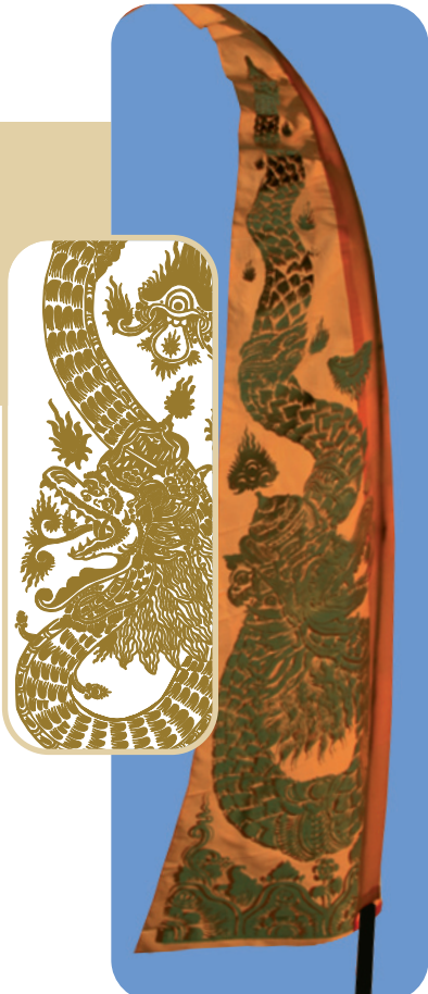
BALI-FAHNE MIT DRACHEN DRUCK