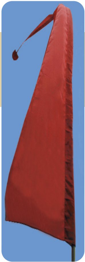
BALI-FAHNE OHNE AUFDRUCK