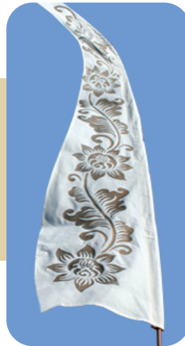
BALI-FAHNE NATURE LOOK MIT STOCK IM PAKET