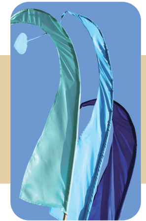
BALI-FAHNE MIT STOCK IM PAKET

Fahnenlänge je: 55 cm s. Farbtabelle 3,30 Euro 1,20 m s. Farbtabelle 7,90 Euro 2,00 m s. Farbtabelle 16,90 Euro