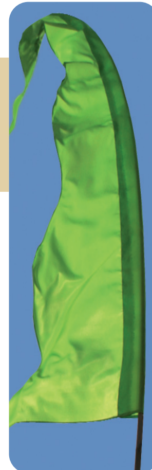
BALI-FAHNE MIT WELLE

Modell 002 Lava 42,90 Euro Nur für Fahnen bis max. 4,50 m